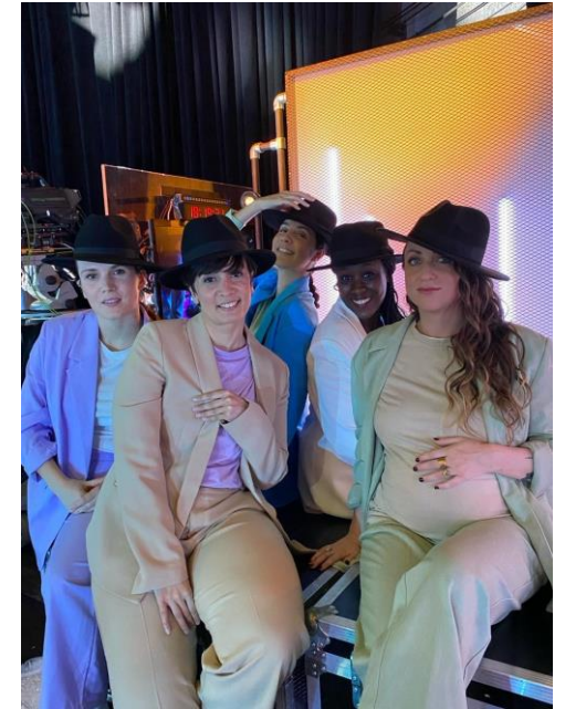
HUMAIN·E chez 'Culturebox'